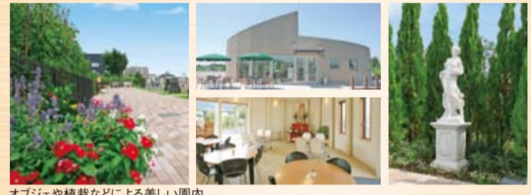
オブジェや植栽などによる美しい園内