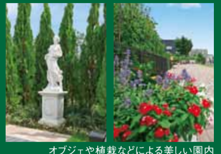
オブジェや植栽などによる美しい園内